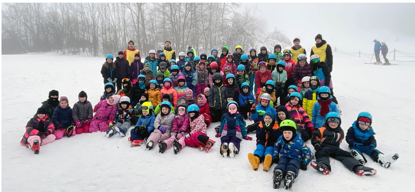
Zimní radovánky v Kladkách - článek na straně 7