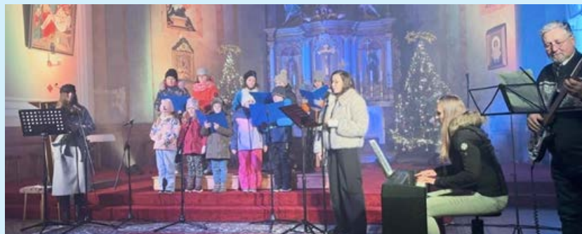
Svatoštěpánské koledování u jeslí – výtěžek z koncertu v částce 11 965 Kč byl věnován Nadačnímu fondu kostela sv. Jakuba Staršího v Městečku Trnávce. Všem dárcům srdečně děkujeme