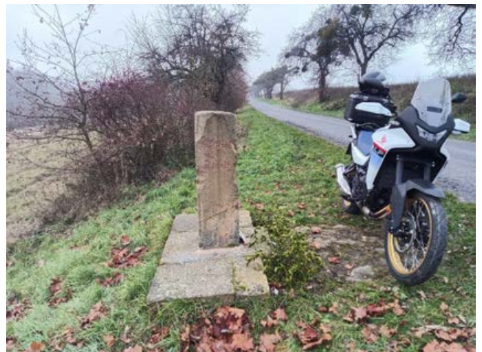
Milník u silnice z Líšnice do Loštic