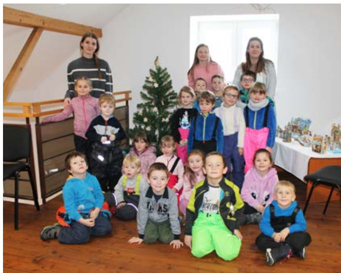
Děti mateřské školy při návštěvě Výstavy betlémů v knihovně

Pokud máte tip za zajímavou přednášku nebo Vy samotní byste se rádi podělili o své zážitky (např. z cest) se svými spoluobčany formou besedy, napište nám, prosím, na: knihovna.trnavka@mtrnavka.cz.